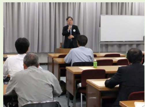
講演される中北副会長