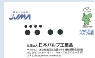
(ばるちゃんのイラスト印刷の使用例: 当会の名刺)