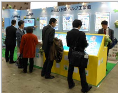
Inter Aqua 2013 での当会展示ブース

会期中、当会ブースにはたくさんの方に訪れていただいたが、来場者のなかには外国の方も多く、バルブのキャラクター“ばるちゃん”がプリントされたノベルティグッズ(エコバック等)は、万国共通で好評であった。