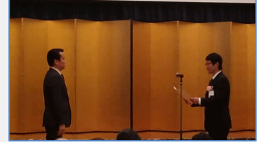
『日本バルブ工業会賞』受賞者への表彰 右：子籠水栓部会長